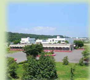
馬淵川浄化センター管理棟全景