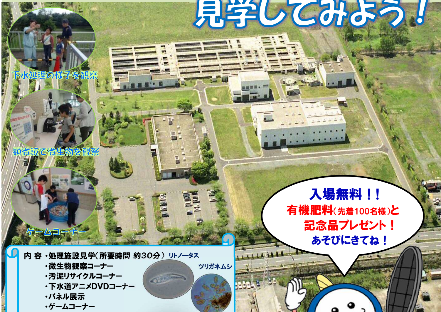
下水処理の様子を観察