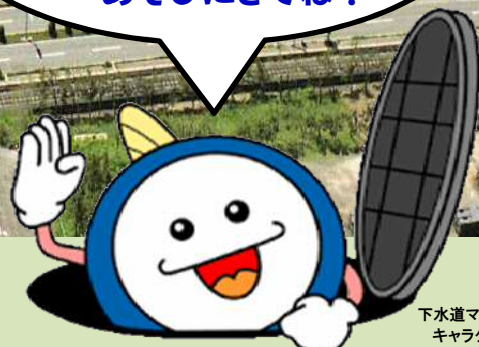
下水道マスコット キャラクター 「スイスイ」